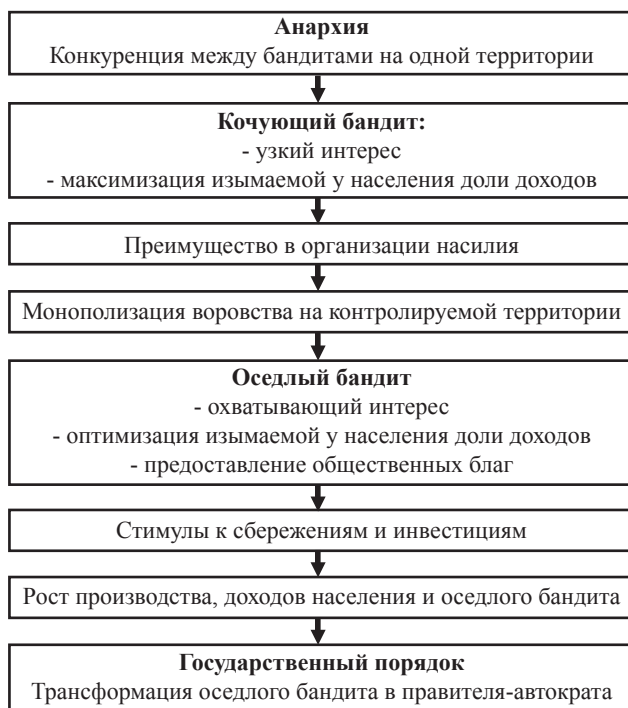
Рис. 1. От анархии кочующих бандитов к государственному порядку автократа.

По Олсону, преодоление анархии кочующих бандитов возникает, подобно рыночному порядку, из эгоистических стремлений тех же бандитов к максимизации взимаемой с общества дани. Необходимые условия этой максимизации образуют принципиально новый порядок, власть оседлого бандита, становящегося автократом (автократическим правительством). Самоограничение в налогообложении и предоставление общественных благ приводят к гигантскому скачку в росте выпуска и, как результат, доходов самого автократа. С нашей точки зрения, по аналогии с неолитической революцией, этот переход к качественно новому порядку можно назвать государственной революцией, обеспечившей, возможно, не менее крупномасштабное расширение производственных возможностей общества, чем первая. Ниже, на рис. 1, представлена схема, обобщающая изложенные идеи Олсона.